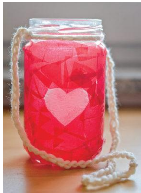
Slika 1. Slika 2.